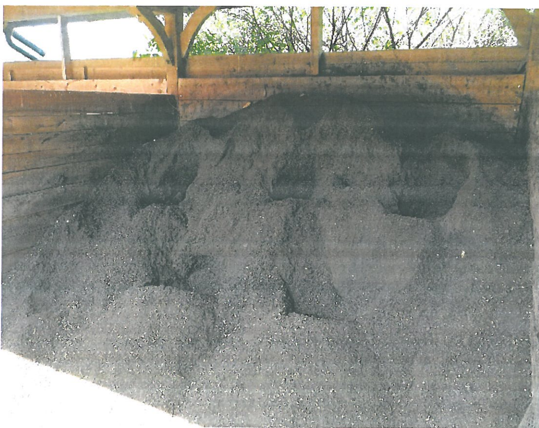
Slika 1. Fotografija vzorčenega materiala

Obravnavana količina komposta: cca. 8 m 3